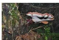
Tikrinis blizgutis. Ganoderma lucidum Nuotrauka S. Sidabro.